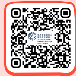
藥健同心博愛醫院社區藥房 PHARM+ Pok Oi Hospital Community Pharmacy